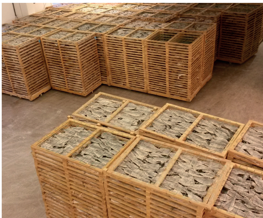
Tørking av klippfisk.

Felles for alle bedriftene er at man har store mengder overskuddsvarme fra tørkeanleggene. Målet er å utnytte denne varmen best mulig for å spare energikostnader. Meningen er at man kan bruke den til å varme opp uteluft og blåse denne luften inn i lager og haller. Dette er spesielt gunstig fordi uteluften har lav luftfuktighet som er viktig i de periodene fisken ikke er inne i selve tørkeanlegget.